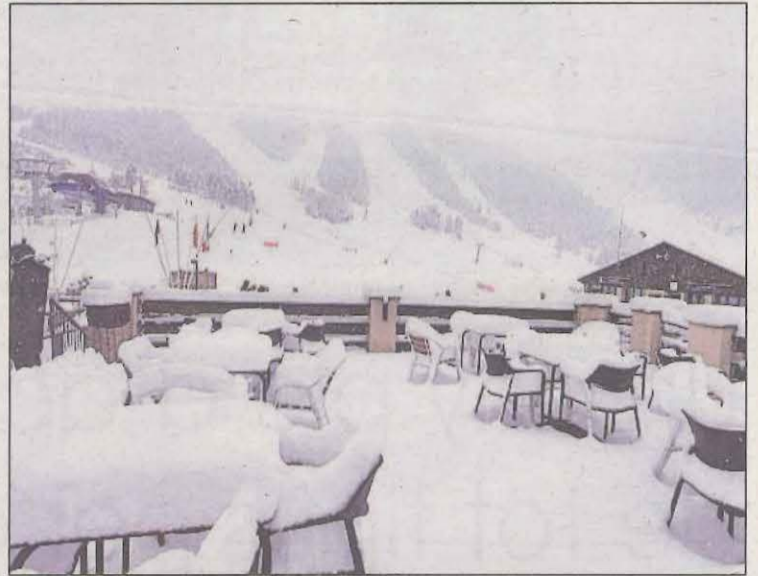
Gruixos de 20 centímetres a l'estació d'Espot

D'altra banda, el servei de Protecció Civil va activar ahir dissabte l'alerta del Pla Inuncat pel risc de fort onatge durant aquest cap de setmana. En concret, el temporal marítim es preveu que ha d'afectar el litoral nord amb onades que poden superar els 4 metres i impactar directament a la línia de costa, i que podrien provocar inundacions al front marítim.