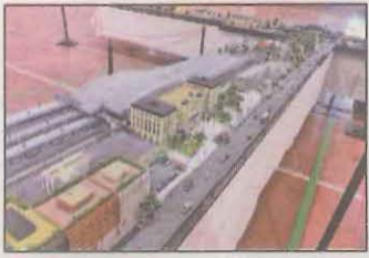
Avui diumenge es pot visitar al matí