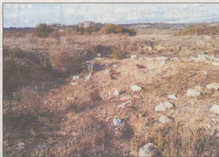
L'espoli va ser al Tossal de les Tenalles de la Mora

Els Agents Rurals investiguen l'espoli comès al jaciment arqueològic del Tossal de les Tenalles de la Mora, a la Segarra. De fet, van indicar que l'acte s'havia realitzat amb detectors de metalls i altres eines auxiliars. "En els darrers anys hem experimentat un increment de l'ús il·lícit dels detectors de metalls", van assenyalar.