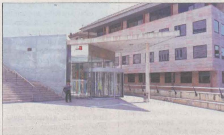
El judici serà a l'Audiència de Lleida el proper 24 de març

En aquest sentit, segons relata el ministeri fiscal en el seu escrit d'acusació, el citat monitor es va aprofitar que s'encarregava de la vigilància nocturna per entrar de matinada a l'habitació on dormia la menor, de 13 anys, i fer-li tocaments per sobre de la roba. En tenir coneixement, els pares de la nena ho van denunciar el passat 2019. Cal indicar que el judici se celebrarà a l'Audiència Provincial de Lleida el 24 de març i l'home està acusat d'un delictes d'abús sexual a menor de 16 anys.