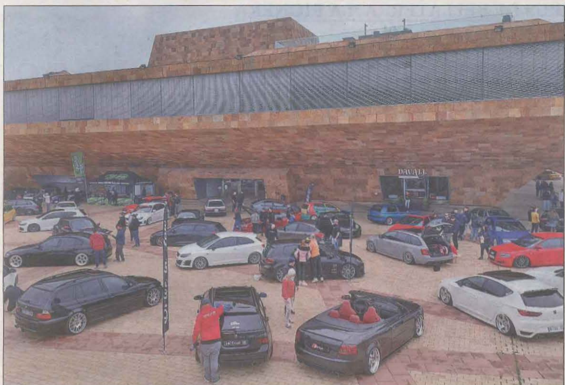
Els participants van poder gaudir del motor i la cultura i la gastronomia de Lleida