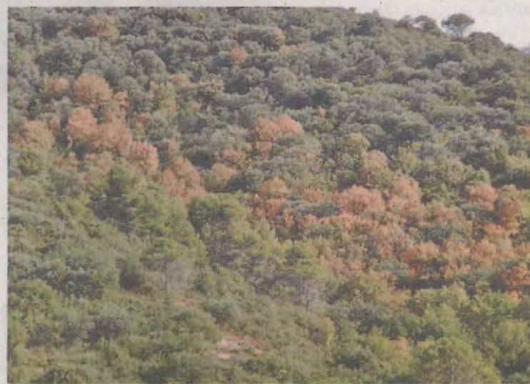
Un bosc de la Noguera afectat per la sequera

recanvisjoanlleida@hotmail.com Telf. 973 269 230 www.eparts.es