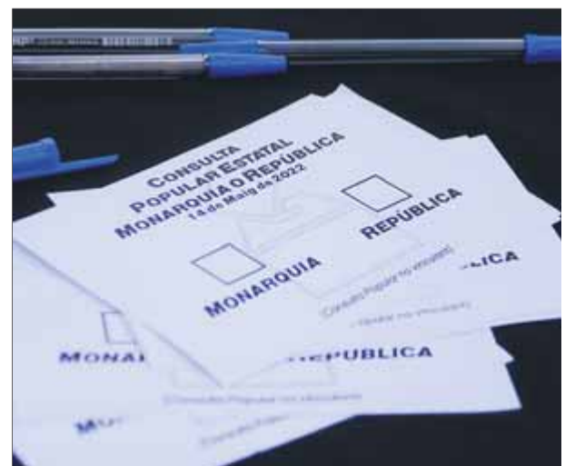
Una papereta de la consulta popular sobre monarquia o república

ciutadania la forma d'estat". "Som en el 2022, ja és hora que ens deixin decidir si volem monarquia o república", va apuntar. Per ella, la consulta ciutadana és "una manera de deixar en evidència la falta de democràcia" per part del govern espanyol per "no voler convocar un referèndum vinculant". En la consulta podran votar els ciutadans majors de 16 anys i al final del dia es farà el recompte i els resultats es faran públics a través del web Plataformaestatalmonarquiaorepublica.org. ■