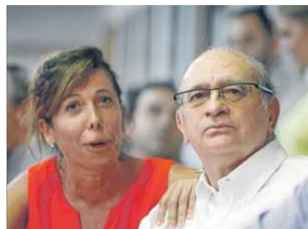
L'exlíder del PP Alicia Sánchez-Camacho, amb l'exministre Jorge Fernández Díaz

Per Maragall, la falta d'inversions és "absolutament inacceptable". En aquest sentit, va advertir que ERC demanarà la recuperació dels 12.383 milions d'euros de déficit d'inversions a Catalunya. Es tracta de la quantitat que el govern de la Generalitat va reclamar divendres en el marc la reunió de la subcomissió tècnica de la bilateral d'infraestructures Estat-Generalitat, celebrada a Barcelona. En concret, es reclama la transferència de 3.000 milions com a aplicació de la disposició addicional tercera del període 2009-2013 i un pla d'inversions específic de més de 9.000 milions el compliment del qual s'avalui anualment. ■