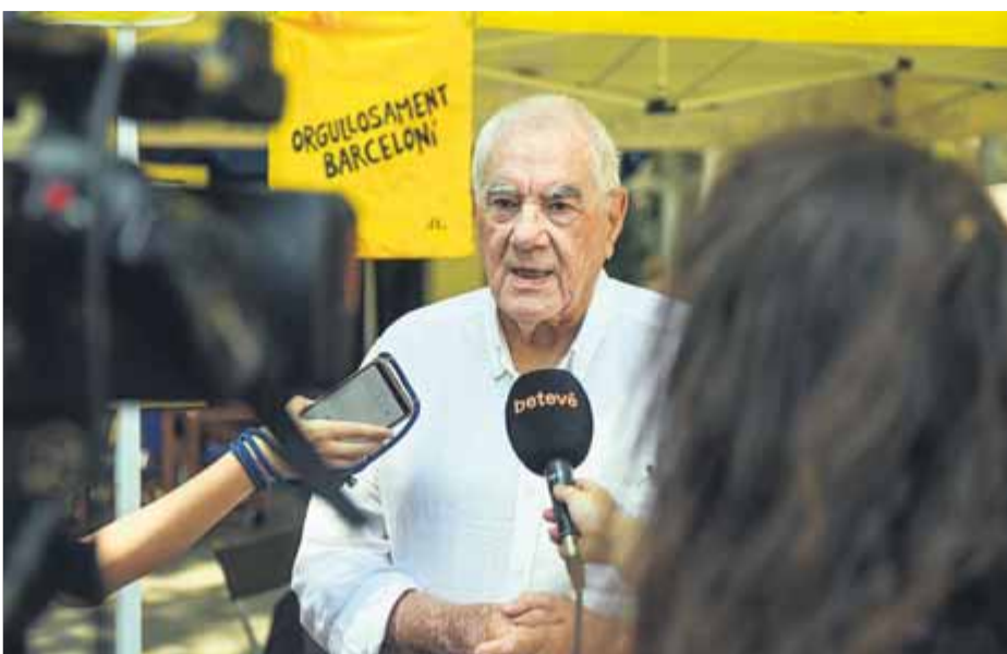
Ernest Maragall, l'alcalde d'ERC a Barcelona, ahir, a les Corts