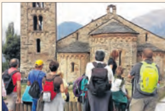
Turistes davant l'absis de Sant Climent de Taüll.