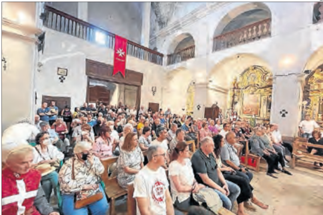
L'església del Palau va quedar ahir petita per escoltar la conferència sobre la seua història.

A partir de les sis de la tarda es va obrir el mercat, amb parades de productes típics com