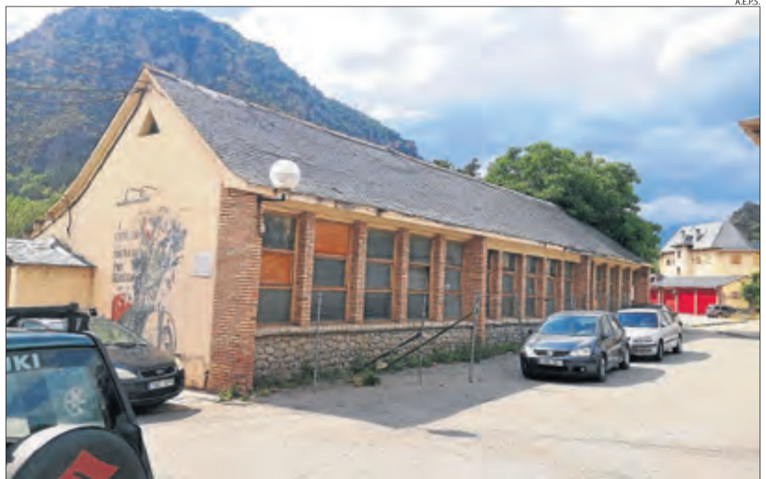
L'edifici de la Confraria Vella, que s'enderrocarà enguany per fer un estacionament.

La Vella Confraria acollia antigament la celebració de les festes de Sant Sebastià. Fa anys, es van traslladar a la nova seu. L'immoble es troba