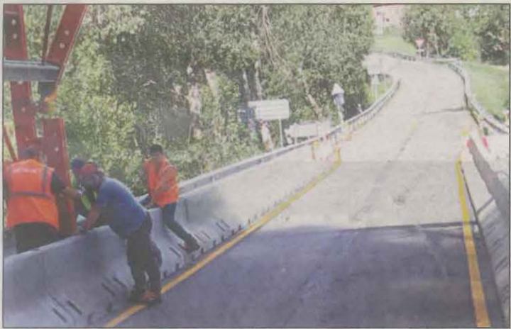
Els operaris treballant ahir