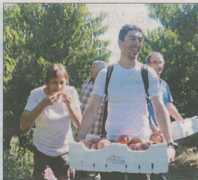
Alguns dels visitants de Fruiturisme

Finalment, el sector de l'hoteleria, més diversificat tant a les comarques de Ponent i a la mateixa ciutat de Lleida com també al Pirineu, ha retrocedir en els mesos de juny a agost en el nombre de pernoctacions un 1,6% en relació al 2019, però ha augmentat la xifra de pernoctacions en un 7,8% respecte al 2021. En els dos primers mesos d'estiu, juny i juliol, el sector ha tingut un millor comportament que l'any passat, amb un 18,6% més de pernoctacions i un increment d'un 2,4% respecte al 2019.