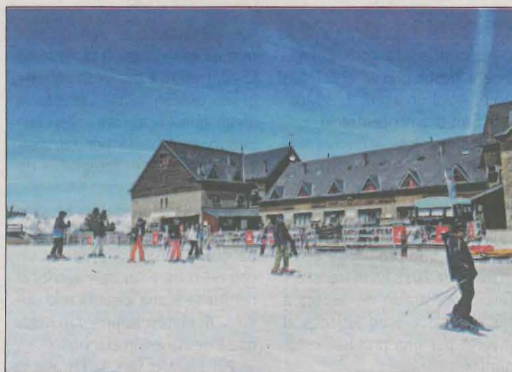
Imatge d'arxiu de l'estació d'esquí de Port Ainé

Coincidint amb la posada a la venda dels forfets de temporada, ja està disponible també la promoció 4x3 de la Molina, que permet esquiar quatre dies a l'estació de la Cerdanya durant la temporada per 35,25 euros al dia.