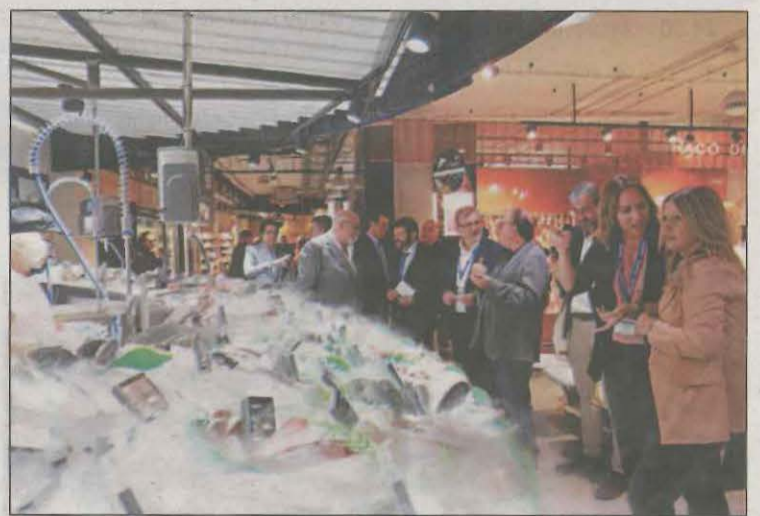
La companyia va presentar ahir el nou model de 'súper'

Per a fer-lo realitat, la companyia invertirà 15 milions d'euros en els tres propers anys per adaptar progressivament aquest nou model en alguns dels seus establiments que té a Catalunya i en l'obertura de nou supermercats.