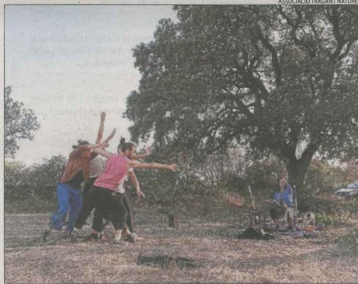
Un dels espectacles en plena natura, l'any passat.

Informació, programació i venda d'entrades per als espectacles, al web 'festivalnatures.com'