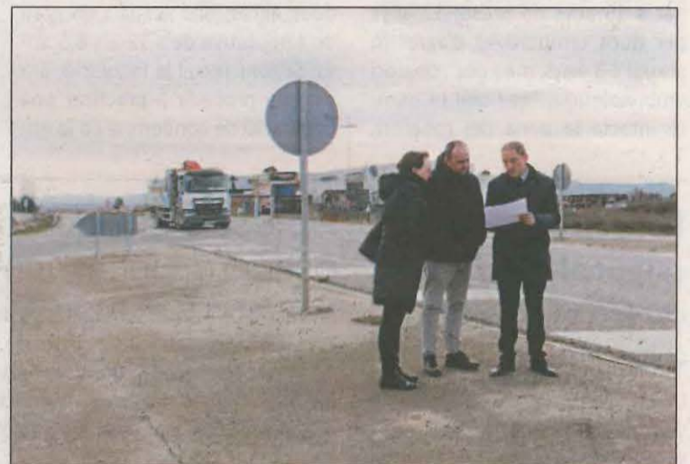
Crespín es va reunir ahir amb l'alcalde de Juneda

El projecte, aprovat el passat mes de desembre pel Ministeri i en fase ara mateix d'informació pública, té un pressupost de 3,8 milions d'euros i preveu la conversió en rotondes dels tres encreuaments o cruïlles situades a l'entrada de Juneda (quilòmetre 72,500. Rotonda de la Cooperativa), en la connexió amb la LV-2001, de Juneda a Torregrossa (quilòmetre 74,500) i a la sortida de Juneda (quilòmetre 75,500). Crespín va