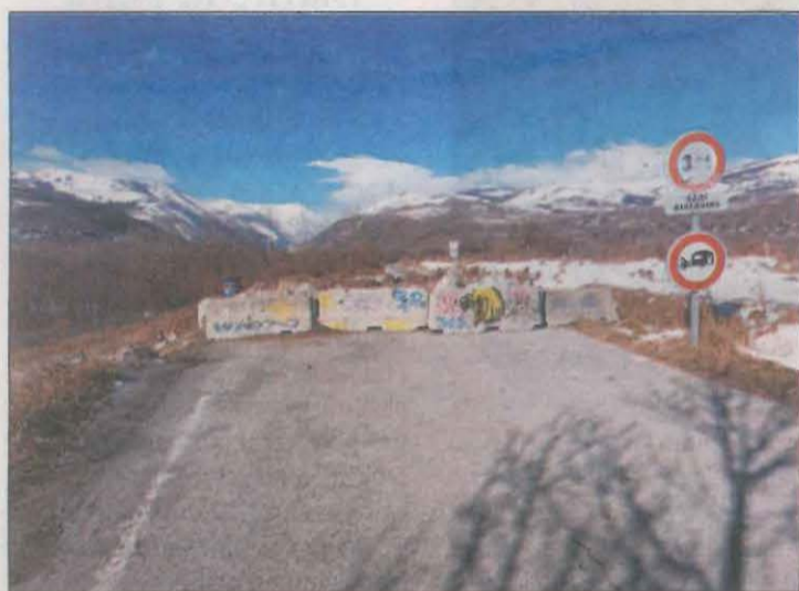
Pas fronterer camí de la Vinyola de Puigcerdà

Del total dels més de 7 milions d'euros que l'Àrea de Salut ha mobilitzat des de l'any 2019 fins al 2022, la xifra pendent de resoldre i liquidar és de 694.381 euros, la majoria dels quals haurien d'estar liquidats al llarg del primer trimestre d'enguany, segons va assenyalar la Diputació de Lleida.