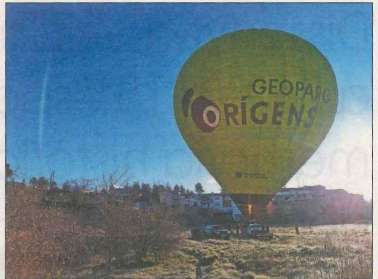
Van utilitzar un globus per fer una prova de llançament

Aquest repte forma part d'un treball de recerca de batxillerat entre cinc alumnes i tres professors. El valor afegit d'aquest projecte ha estat precisament aquesta cooperació interdisciplinària.