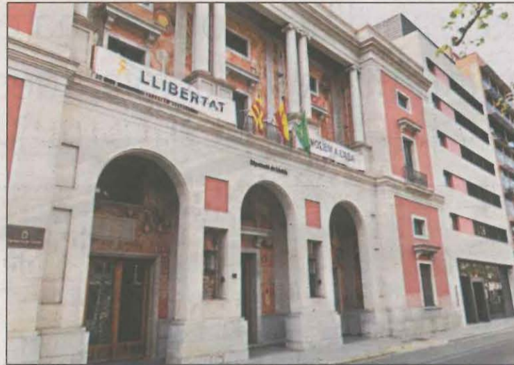
Imatge de la façana de la Diputació de Lleida

Els socialistes van assenyalar durant la Comissió d'Economia, que la corporació acumula "impagaments i retards" des de l'any 2010, un fet que ha provocat el cessament d'activitat d'algunes d'elles, com per exemple FeSalut, que es va veure obligat a aturar la seva activitat a principis de gener.