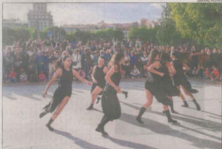
Nombrós públic va gaudir de l'actuació de les escoles de dansa.